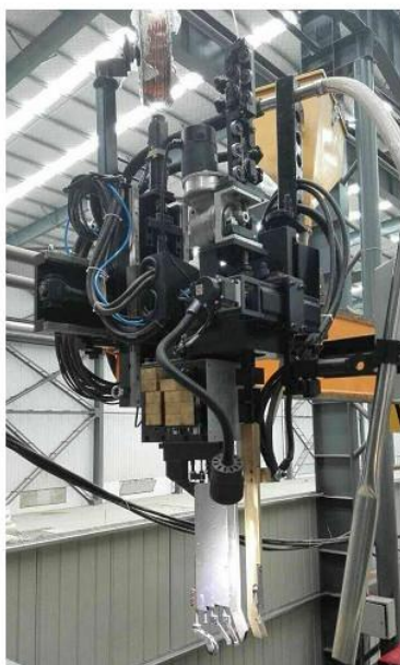
图 3：窄间隙焊接机头（机械跟踪）