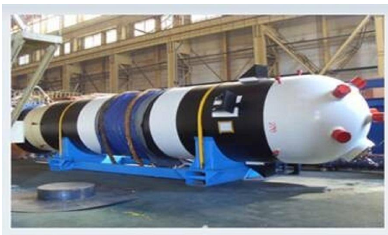
图 1：核电稳压器容器

常规容器的钢材壁厚一般不会超过 50mm，焊接坡口 X 型或者 Y 型，单边坡口角度为 30°。如果厚壁容器坡口单边角度 30°，双边为 60°，焊缝的填充量将相当惊人，焊接质量也无法得到保证。埋弧窄间隙的坡口型式如下图，坡口倾角 3~5°，焊材填充量小，效率高。