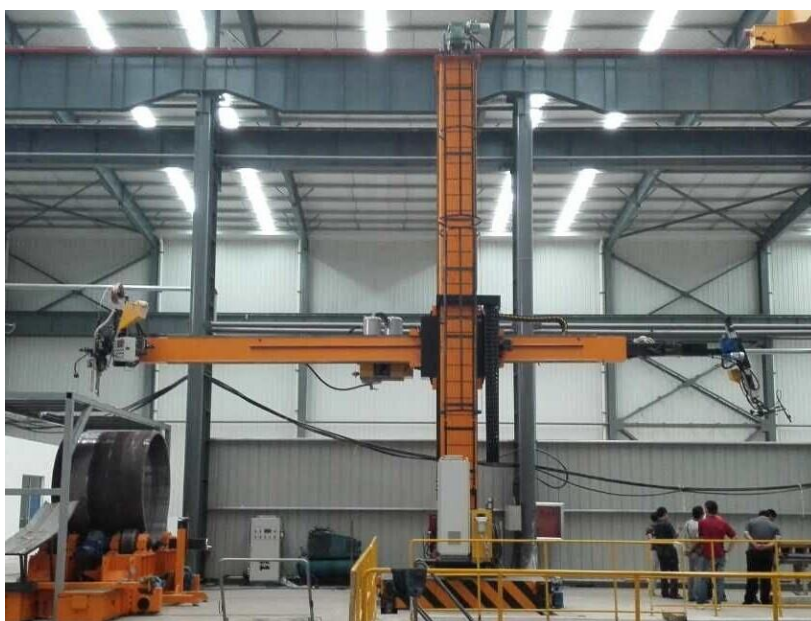
图 5：现场环缝焊接过程